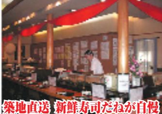
築地直送 新鮮寿司だねが自慢

その他ご予算に応じて承ります 年末年始も休まず営業 無料送迎バス70名様より(予約制)