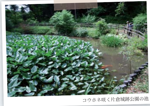
池にはスイレン科のコウホネが黄色い花を咲かせ、花ショウブも見事だった。水車小屋や北村西望の彫刻もあり、よく整備された公園だ。カタクリの群生地もあるのので、次は春に訪れてみたい。

江戸時代末期、横浜が開港して生糸貿易が盛になると、青梅をはじめ多摩や山梨から輸出用の生糸が八王子に集められ、「絹の道」を通って横浜へ運ばれた。その道の一部が当時の面影を残したまま保存されている。文化庁選定「歴史の道百選」にも選ばれた八王子市鎌水(やりみず)地区の「絹の道」を歩いてみた。