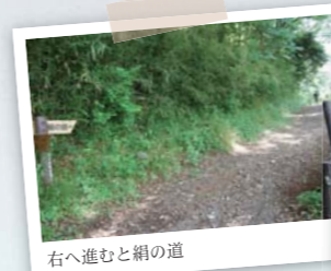
右へ進むと絹の道

公園の階段を下りて国道16号を横切り、日本文化大学の敷地に沿って住宅街の中を行く。40分ほど歩くと八王子バイパスの上に出た。右に10メートルほど行くと、目の前に長くて急な石段が立ちふさがり、覚悟を決めて上り始めた。中ほどで振り返ると眼下に八王子の街が広がっている。